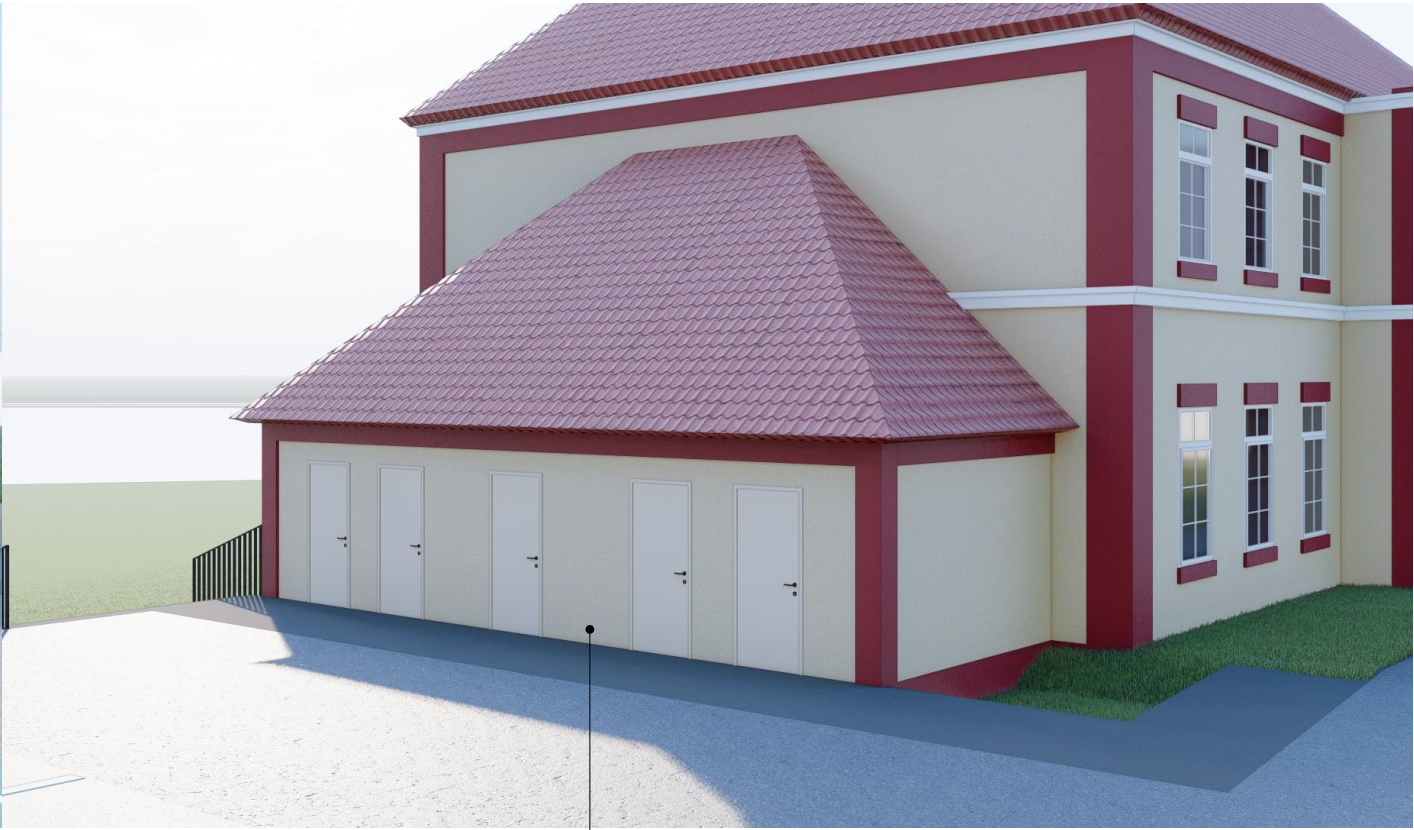
Projektowane komórki lokatorskie