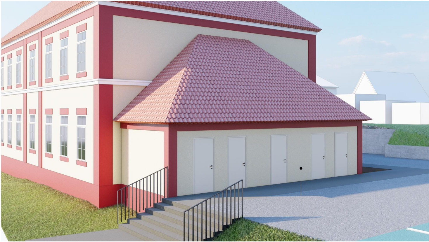
Projektowane komórki lokatorskie